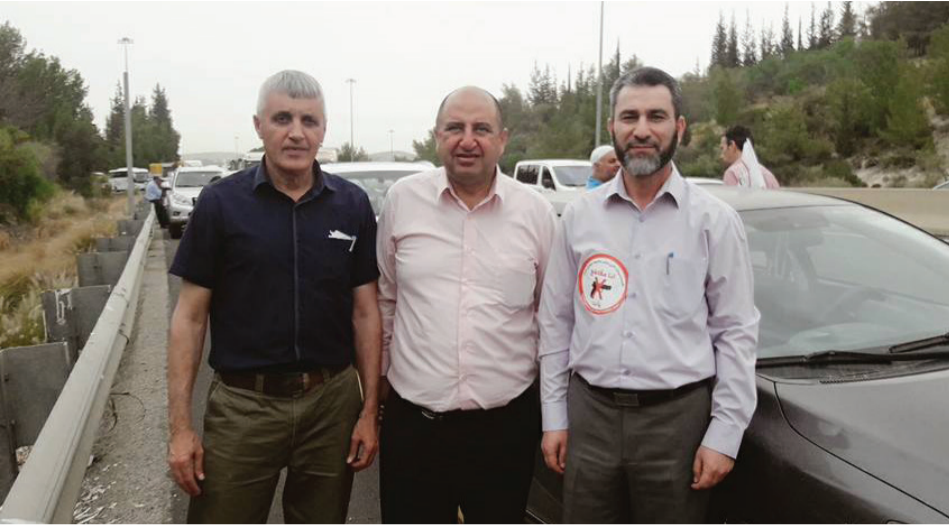
مسيرة السيارات التي إنطلقت من مدينة أم الفحم إلى القدس، احتجاجاً على تفشي حالات القتل والعنف في مجتمعنا العربي وتقايس الشرطة في علاجها 6-05-2018