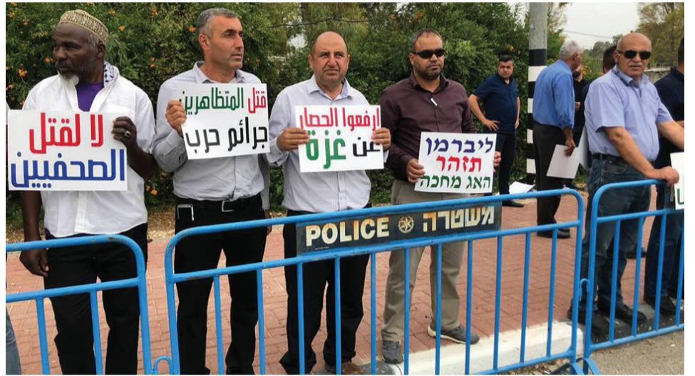
مظاهرة القطرية عند حاجز إيرز 4-05-2018