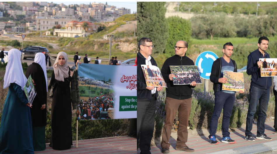
وقفة لحزب الوفاء والاصلاح تضامناً مع غزة 3-4-2018