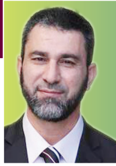
بقلم الشيخ حسام أبو ليل رئيس حزب الوفاء والإصلاح

أم وأب + إدراك للهوية + تلبية الحاجات الأساسية + منظومة قيم سوية = مجتمع حضارة.