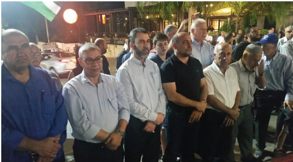
الوفاء والإصلاح يشاركون في إحياء الذكرى الـ 13 لشهداء مجزرة شفاعمرو 5-08-2018