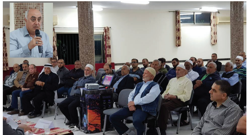
2018-04-13 ندوة 'الطلاق كظاهرة آخذة بالإتساع.... كيف يمكن الحد منها'