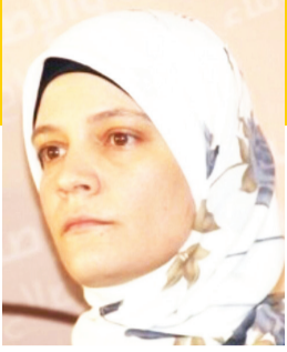
بقلم المربية هبة هريش عاودة عضو حزب الوفاء والإصلاح