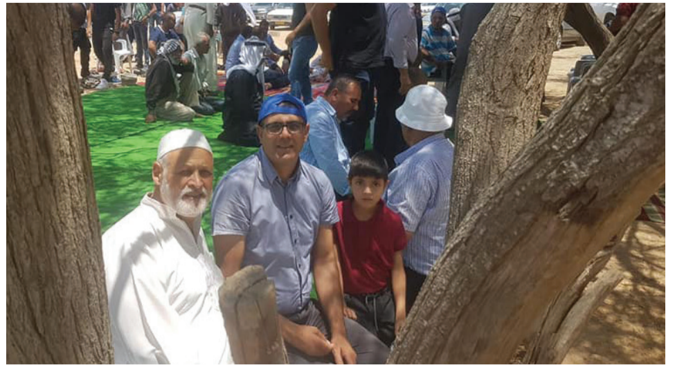
29-05-2018 مشاركة وفد الوفاء والإصلاح في صلاة الجمعة في العراقيب.