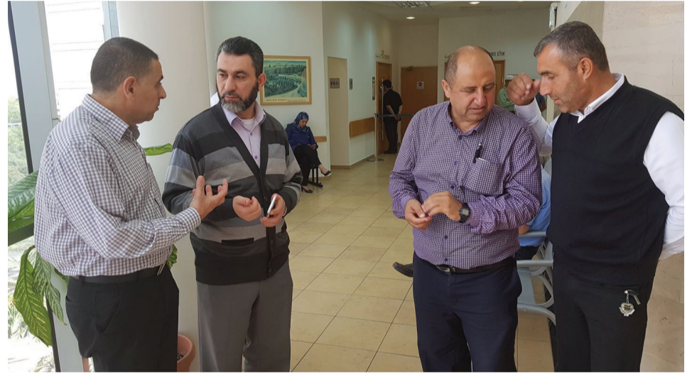
2018-05-7 محكمة الصلح في الكريوت حيفا لحضور جلسة بشأن مقبرة القسام.