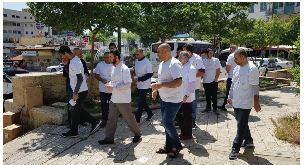
توزيع هدية رمزية على السائقين والمارة في الناصرة 14-04-2018