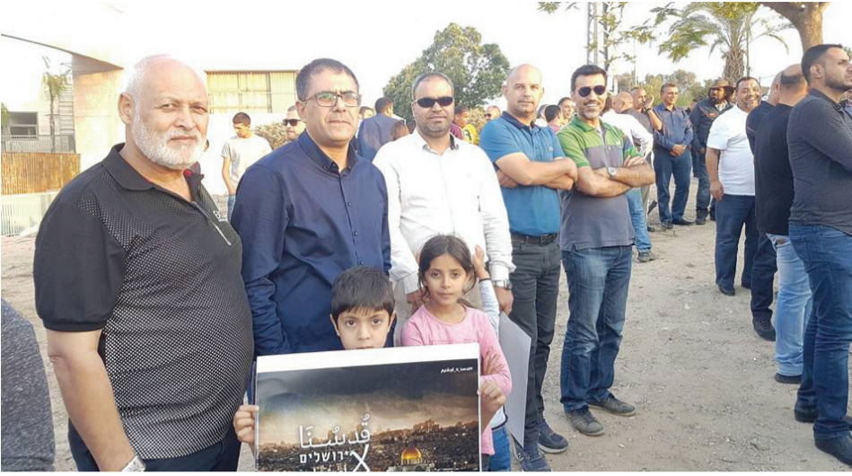
15-05-2018 مشاركة أعضاء في حزب الوفاء والإصلاح في المظاهرات الإحتجاجية في رهط ضد مجزرة الإحتلال الإسرائيلي في غزة.