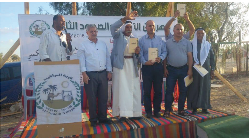
28-07-2018 وفد الوفاء والإصلاح أثناء مشاركته في مهرجان التحدي والسمود الثامن في العراقيب.