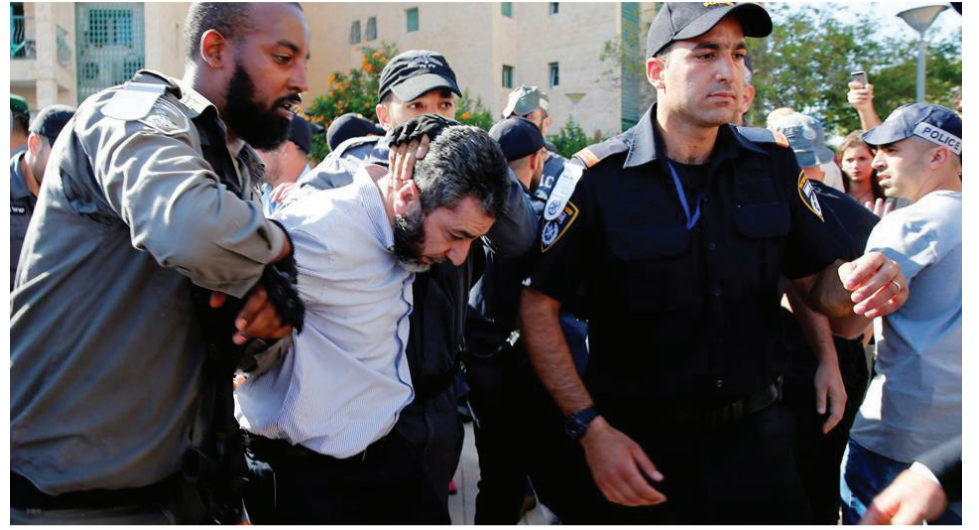
14-05-2018 المظاهرة القطرية في مدينة القدس ضد نقل السفارة الأمريكية للقدس،