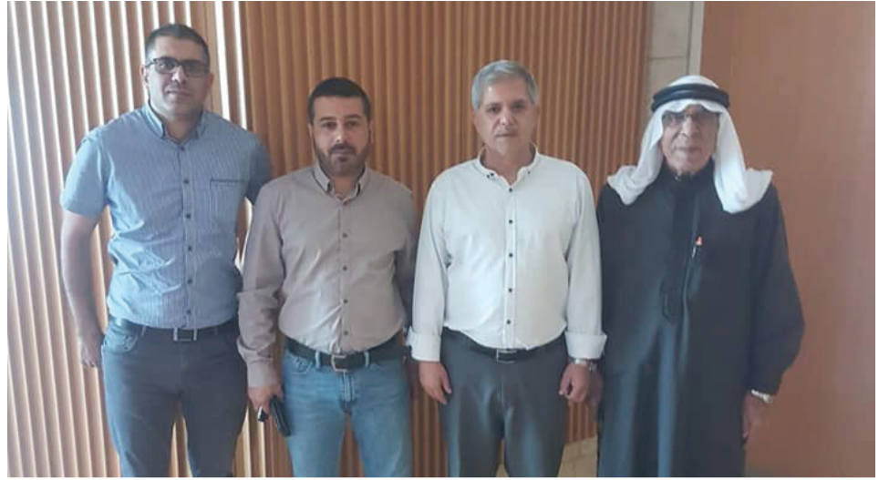
محكمة بئر السبع قضية صياح الطوري