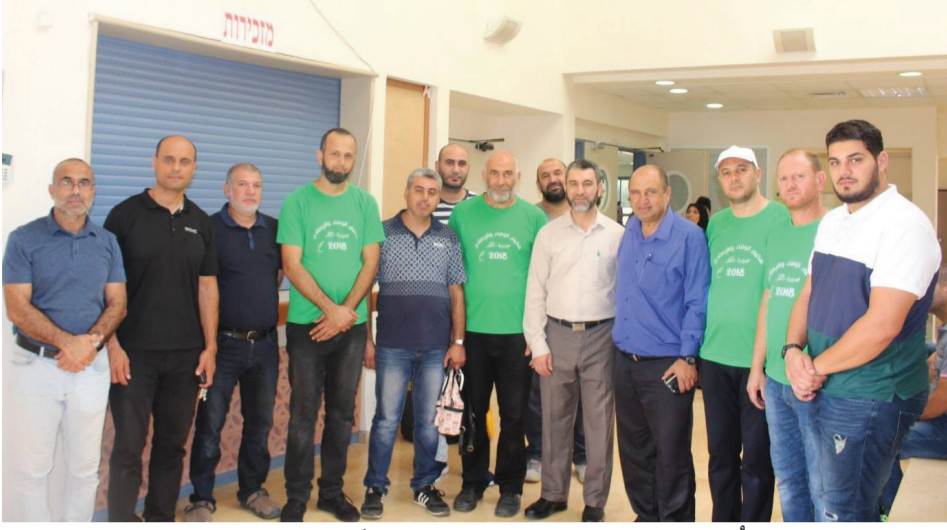
2018-08-4 وفد قطري من الوفاء والإصلاح يحل ضيفاً على المخيم الصيفي للأطفال الذي يقيمه فرع الحزب في الجديدة.