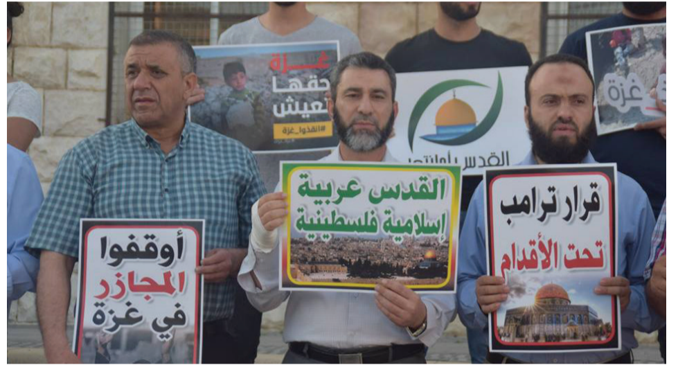
15-05-2018 مظاهرة المحلية في عين ماهل تنديدا بمجزرة الإحتلال الإسرائيلي في غزة ونقل السفارة الأمريكية إلى القدس.