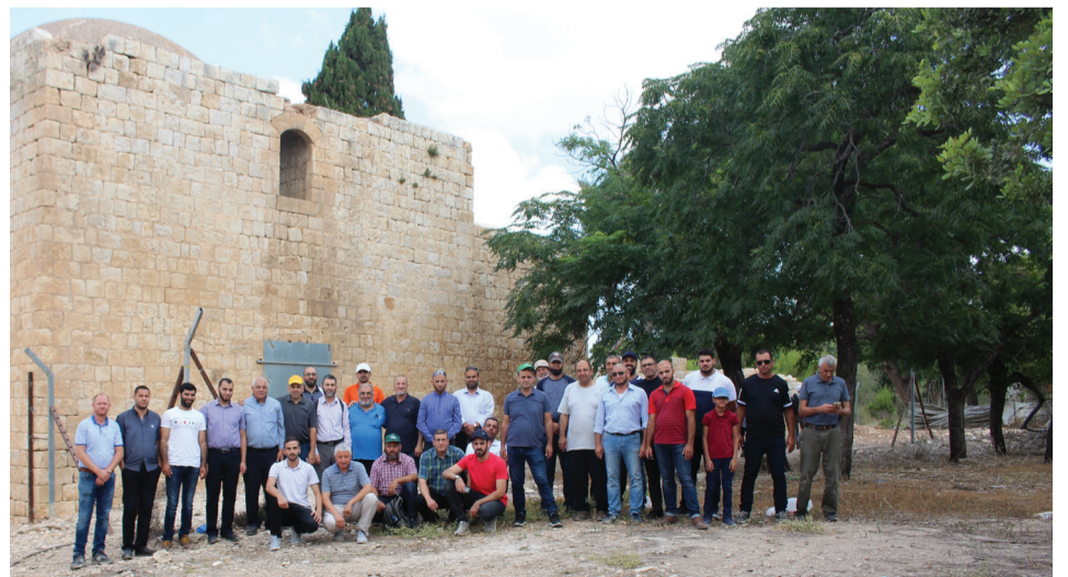
رحلة الفروع لمنطقة عكا يوم 21.7.18