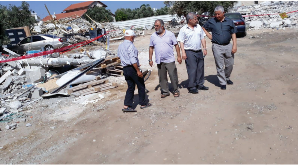
19-07-2018 وفد عن حزب الوفاء والإصلاح في زيارة تفقدية لأصحاب البيوت المهتمة في اللد.