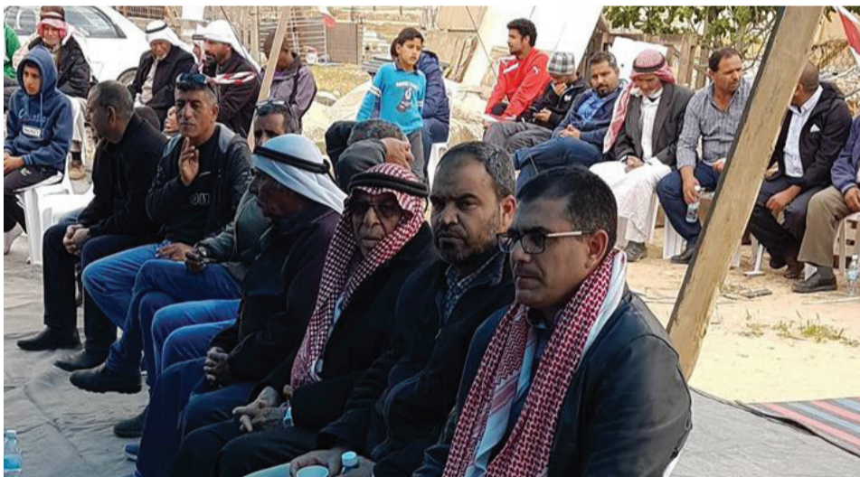
ذكرى يوم الأرض - النقب 30-03-2018