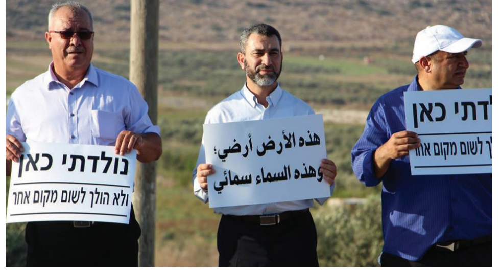
2018-08-4 الوفاء والإصلاح يشارك في وقفات الإحتجاج على قانون القومية التي دعت إليها لجنة المتابعة العليا.