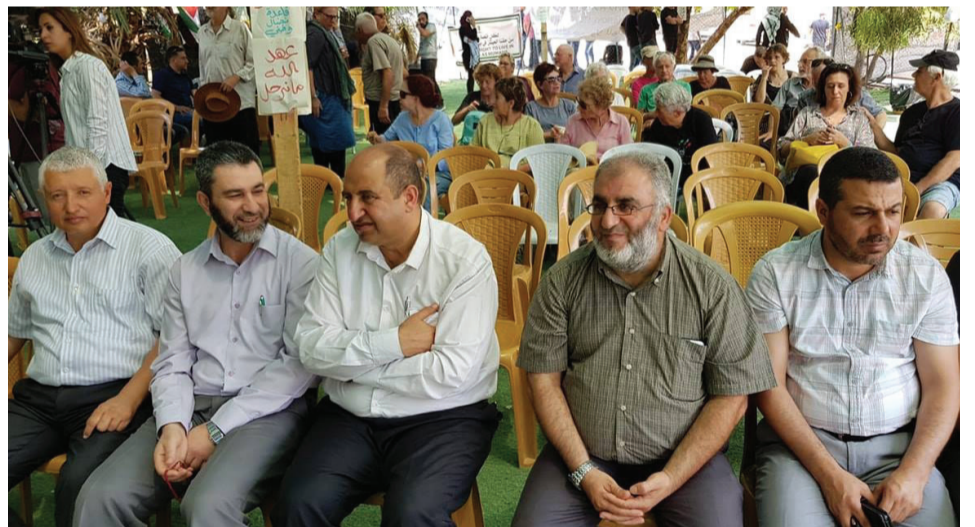
وفد الوفاء والإصلاح في زيارة تضامنية للأهل في الخان الأحمر 14-07-2018