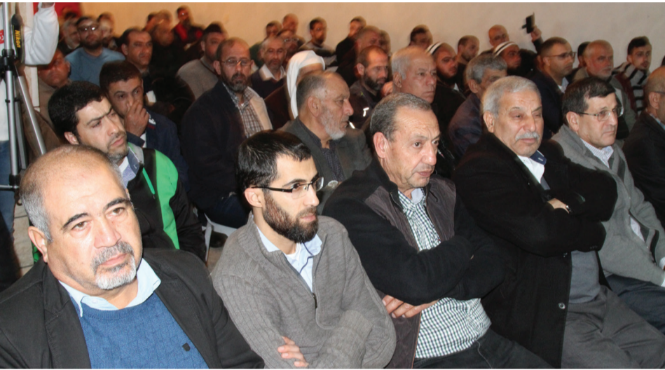
ندوة لحزب الوفاء والاصلاح عن القدس في الناصرة 16-2-2018